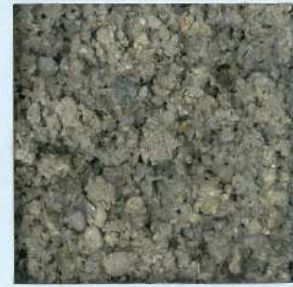
カラーグライト3号F